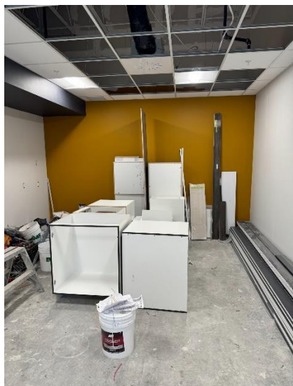
Salle des employés Mur du fond : 14 pieds de largeur Mur latéral : 22 pieds de largeur