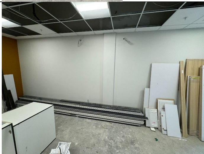
Salle des employés Mur du fond : 14 pieds de largeur Mur latéral : 22 pieds de largeur