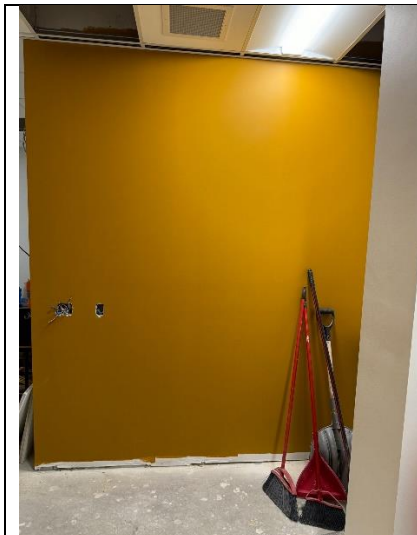
Mur avant d'entrée dans la salle de réunion Dimension non disponible